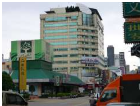
A社台湾事務所の入っているビル

駐在員事務所開設後は、日本人社員のモラル向上、現地採用社員の活躍などもあって順調に事業拡大しています。しかし、従来知らなかった台湾独特の商慣習を経験したり、台湾特有の制度に直面したり、試行錯誤を続けています。